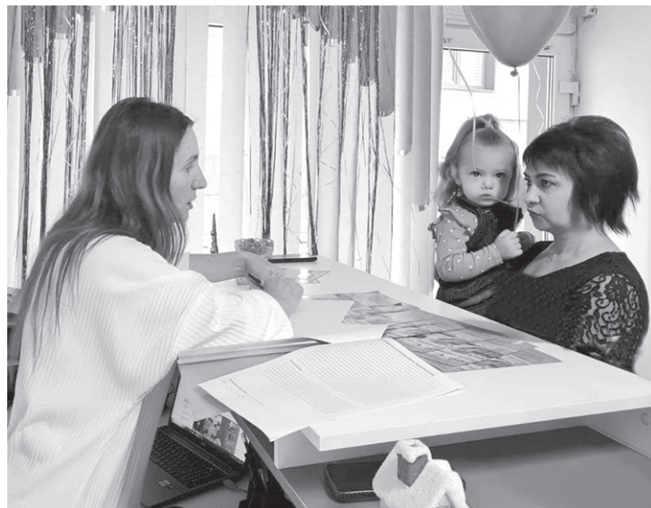
Центр продолжает оказывать помощь семьям с детьми

Обратиться в Семейный МФЦ можно по адресу: Черкесск, ул. Октябрьская, 74, а также по телефону: 8 (878-2) 21-32-30 . Для экстренных случаев: 8 (928) 925-11-09 (круглосуточно)