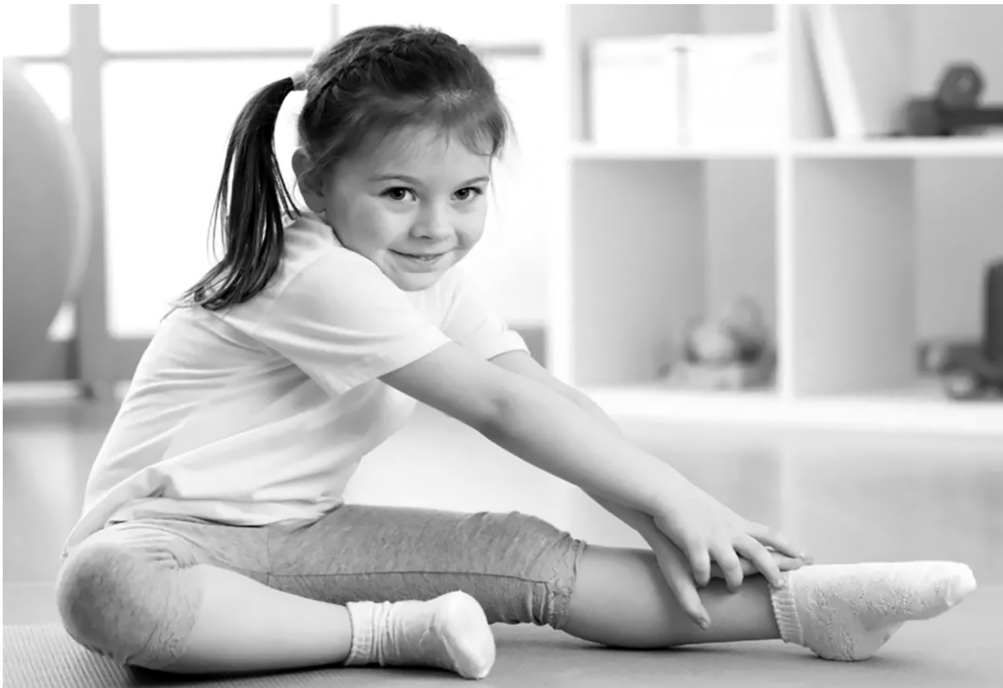
Двигательная активность очень полезна для растущего организма

Это послужило основанием для выбора таких приоритетных направлений государственной политики в области здравоохранения, как охрана и укрепление здоровья, формирование у детей здорового образа жизни. Кроме государства, большая роль здесь отводится медицинским учреждениям первичного звена, где идет наблюдение за состоянием и здоровьем детей, а также проводятся профилактические мероприятия, направленные на его укрепление. Для этого разработаны целые программы профи-