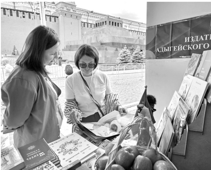
Экспозиция издательства Адыгейского университета